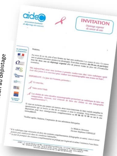
Courrier d'invitation au dépistage

Les radiologues agréés doivent justifier d'une activité mammographique suffisante, faire contrôler leur matériel, se former spécifiquement au dépistage et accepter d'être évalués sur le plan technique et sur l'interprétation. Ils transmettent les fiches d'interprétation des mammographies à l'AIDEC (structure de gestion départementale) ainsi que les clichés qu'ils jugent « normaux » pour la réalisation de la deuxième lecture.